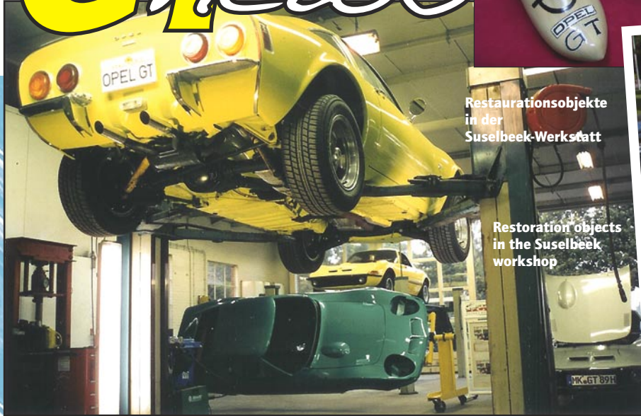
Restaurationsobjekte in der Suselbeek-Werkstatt