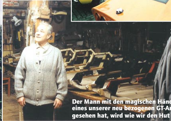
Der Mann mit den magischen Händen! Wer jemals eines unserer neu bezogenen GT-Armaturenbretter gesehen hat, wird wie wir den Hut ziehen vor unserem Sattler.